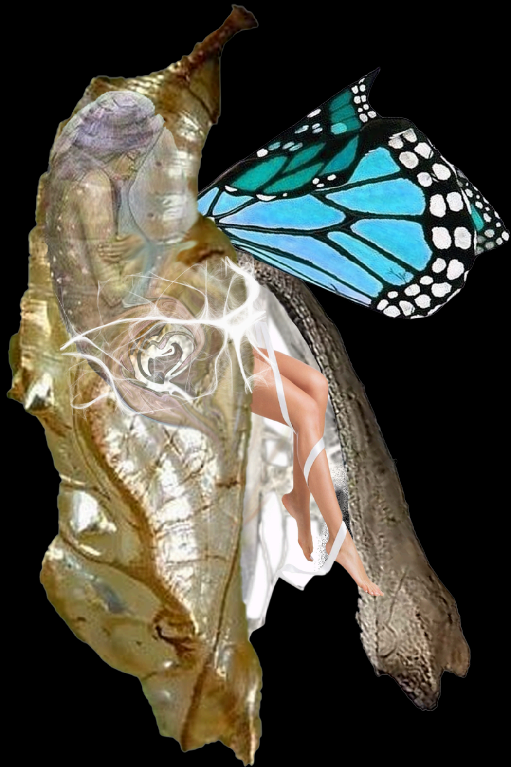
Kén bướm chung “Đôi cánh non nớt”