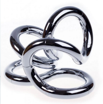
quai túi kim loại