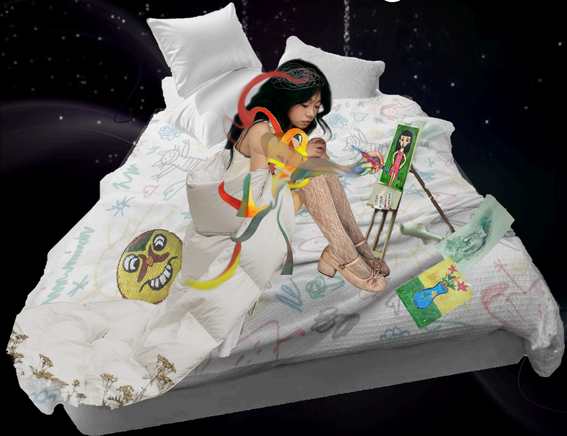
Kén của “tôi” “Những nét vẽ nguệch ngoạc như trẻ con”

CÂU CHUYỆN VỀ VIỆC THOÁT RA KHỎI VÙNG AN TOÀN/ CÁI KÉN