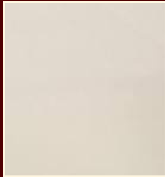
Couro off white