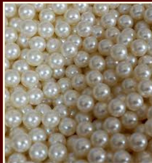
bijuteria de perola