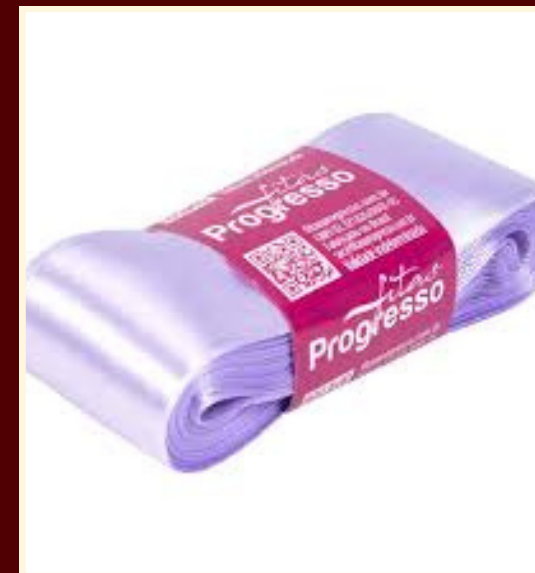
Fita de cetim