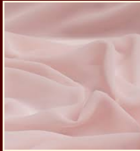
Chiffon beje rosado