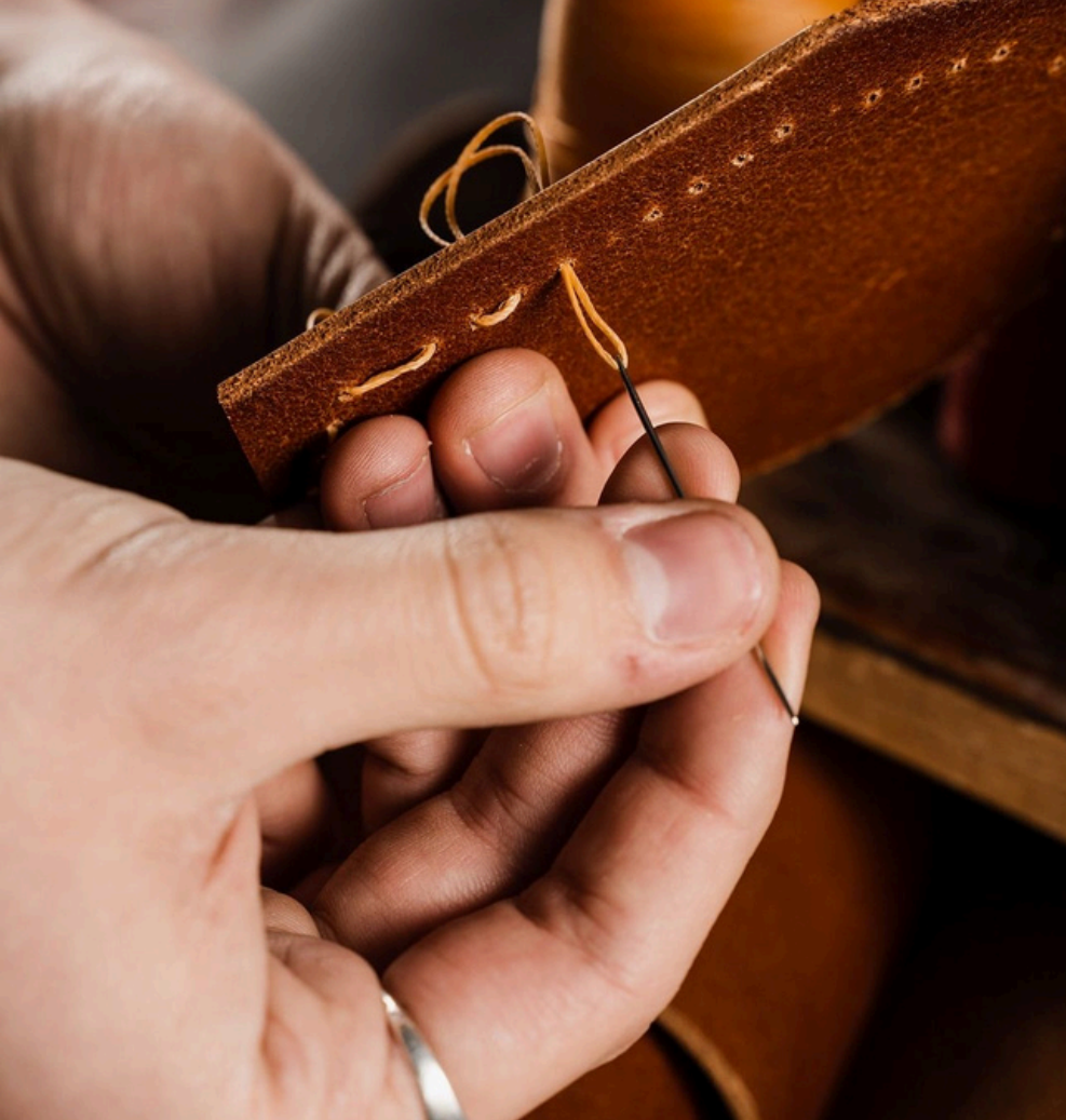
hand- stitched leather