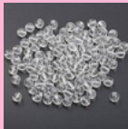
ลูกปัดใส