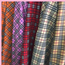
ใช้หนังวัวสีชมพูอ่อน ปีมลายสก๊อต