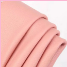
ลายสก๊อต